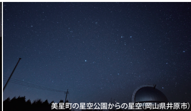
美星町の星空公園からの星空(岡山県井原市)