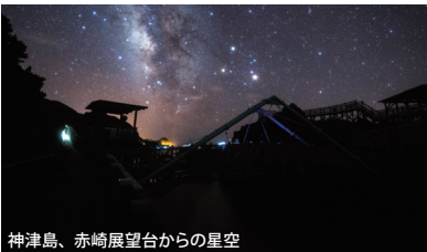
神津島、赤崎展望台からの星空

昨年のツーリズムEXPOジャパン2024では、星空ツーリズム特集エリアを設置、2企業・団体が出展し簡易プラネタリウムの設置やVR体験など様々な展示がありました。観光地としての地域の魅力向上と持続可能な発展のために、地域・企業の情報発信の場として星空ツーリズムエリアを設置します。先進事例をPRする機会にもご利用いただけます。ぜひ、EXPOジャパン2025 愛知・中部北陸をご活用ください。