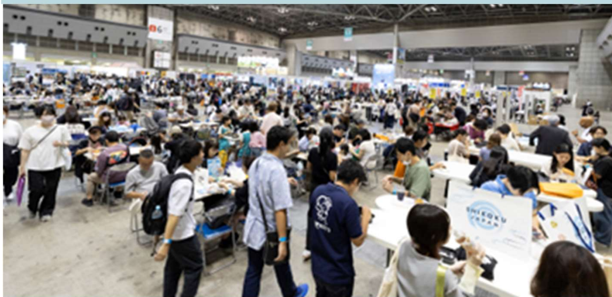
写真：ツーリズムEXPOジャパン2024 飲食エリア

* 会場内飲食出店エリアスペースの確保ができ次第20店舗以上の出店を承る場合がございます