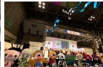
TEJ2024 グランドフィナーレ