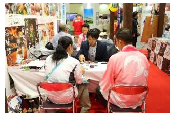
▼アポイントメント商談会の様子▼

ツーリズムEXPOジャパンでは事前マッチングによる2日間のアポイントメント商談会を開催。1小間・スペースにつき2名登録可能、1名につき18の商談枠を提供。商談相手は新たなビジネスモデルを求める旅行会社や海外政府観光局、国内地方自治体やDMO担当者。なお、アポイントメント商談会参加者の情報等は2025年12月末まで閲覧可能。