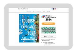
ツーリズムEXPOジャパン公式ホームページ (イメージ)